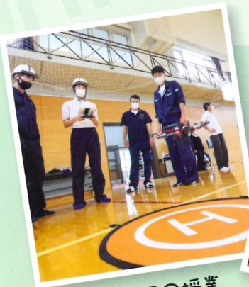
ドローン使用の授業