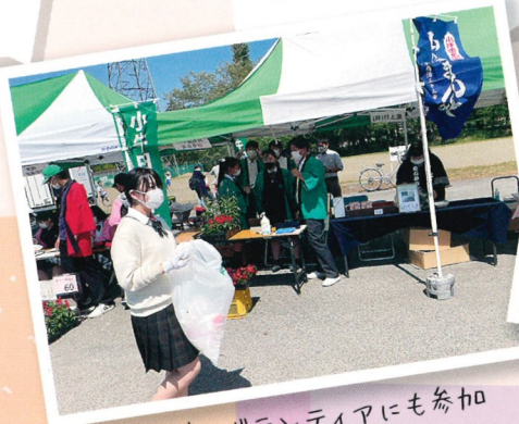
地域のボランティアにも参加