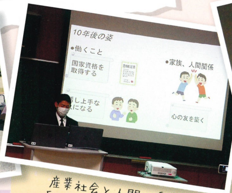
産業社会と人間の授業 「ライフプラン発表会」