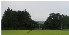
↳ 鳴子温泉エリア 鍛冶谷沢地区の居久根

この写真と右下のマークは大崎耕土「世界農業遺産」スペシャルギャラリー (osakikoudo.jp) から引用しているよ！ 素敵な写真が見られるから調べてみてね！