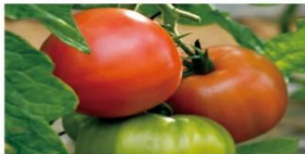
↳ 鹿島台エリア デリシャストマト