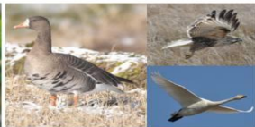
↳ 田尻エリア 蕪栗沼ハードウォッチング