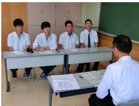
大学・短大（集団面接指導）