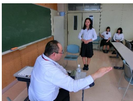
大学・短大（個人面接指導）